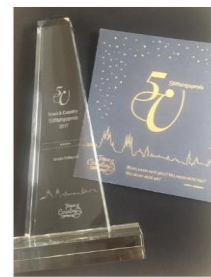
*Ein Gewinner des 5. Town & Country Stiftungspreises 2017*