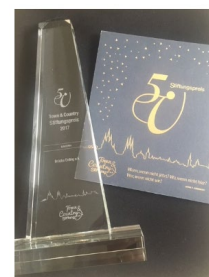
*Ein Gewinner des 5. Town & Country Stiftungspreises 2017*